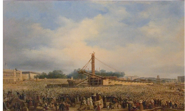
La place de la Concorde en construction vers 1790

La place de la Concorde a été dessinée par l'architecte Gabriel en 1753. Elle est située à Paris dans le 8e arrondissement, au pied des Champs-Élysées.